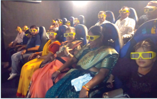
सप्टेंबर महिन्याची फेलोशिप मीटिंग स्टीम एज्युकेशन सेंटर येथे 12D Motion experience घेतांना सदस्य व कुटुंबीय