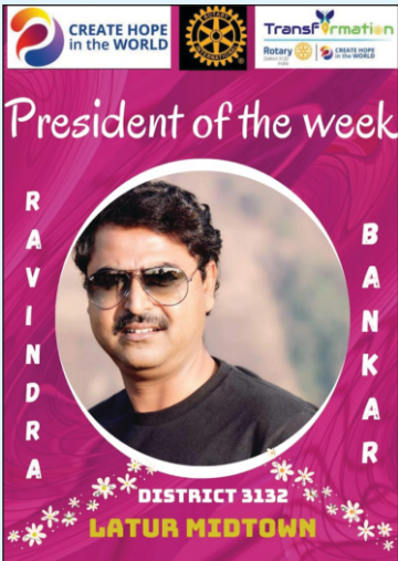
रोटरी इंटरनॅशनल डिस्ट्रिक्ट ३१३२ मार्फत क्लब सदस्यांचा सन्मान