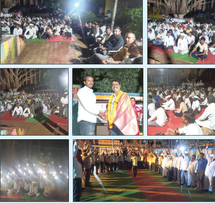
परिवर्तन प्रकल्प- सक्षम अंतर्गत परिवर्तन ग्राम बोकनगाव येथे पशुसंवर्धन विभाग, लातूर (महाराष्ट्र शासन) यांच्या सोबत ७ दिवसीय पशुपालन व दुग्ध व्यवसाय प्रशिक्षण सप्ताह